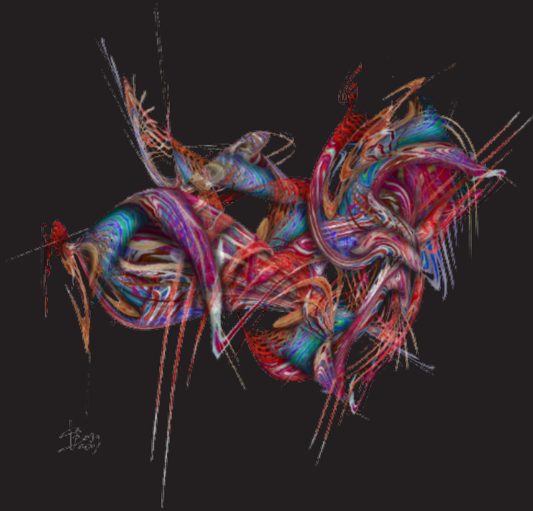
Anachromie n°7 (2022 - 2023)