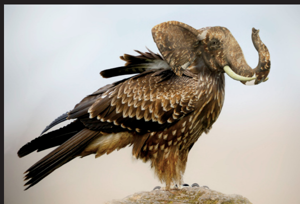
Les animaux en voie d'apparition 2016