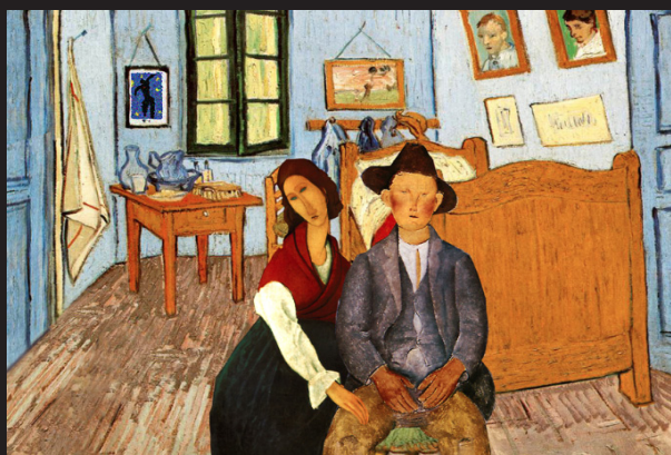
Vang Gogh, Matisse, Modigliani...