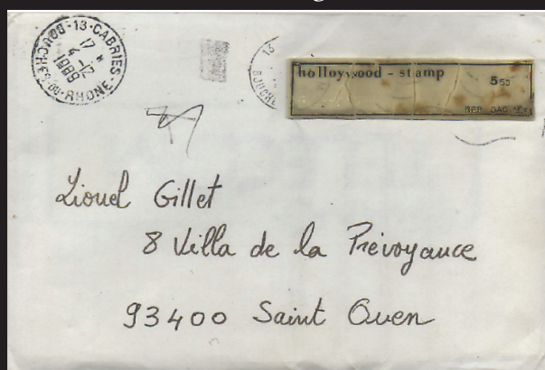
Vrai chewing-gum oblitéré 1989

Dessin, crayon, encre de chine ( 1980 - 2023)