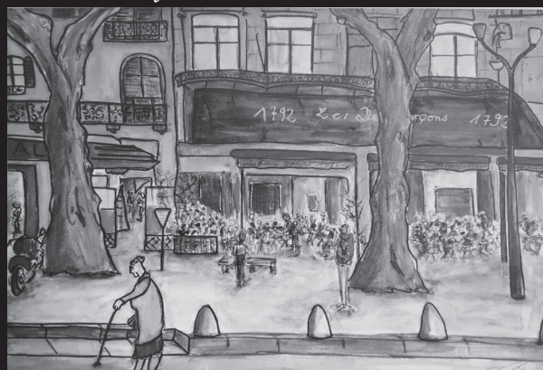
Brasserie les deux Garçons Aix-en-Provence

Dessin, crayon, encre de chine ( 1980 - 2023)